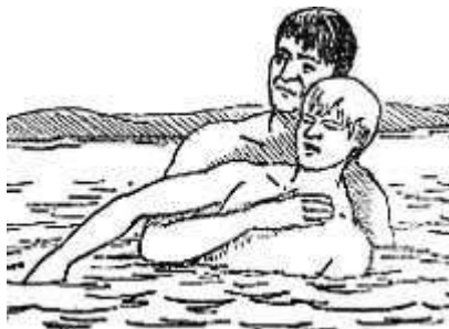
Захват утопающего сзади

Жизнь дается человеку один раз и не надо рисковать ею ради нескольких минут так называемого «экстрима»!