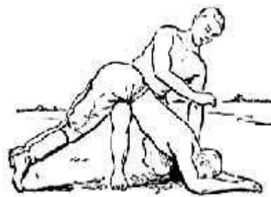
Удаление воды из рта потерпевшего