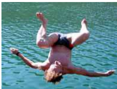
Не ныряйте в непроверенных местах

Для того чтобы избежать несчастного случая на воде лучше всего купаться в специально оборудованных местах: пляжах, бассейнах, купальнях; обязательно предварительно пройти медицинское освидетельствование и ознакомиться с правилами внутреннего распорядка мест для купания, а если таких мест нет, определить место для купания, проверив его с точки зрения безопасности.