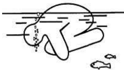
Если нет сил - станьте поплавком

Если что-то произошло в воде, никогда не пугайтесь и не кричите. Во время крика в лёгкие может попасть вода, а это как раз и есть самая большая опасность. Чтобы избавиться от воды, попавшей в дыхательные пути и мешающей дышать, нужно немедленно остановиться, энергичными движениями рук и ног удерживаться на поверхности воды и, поднять голову возможно выше, сильно откашляться. Чтобы избежать захлебывания в воде, пловец должен соблюдать правильный ритм дыхания. Плавая в волнах, нужно внимательно следить за тем, чтобы делать вдох, когда находишься между гребнями волн. Плавая против волн, следует спокойно подниматься на волну и скатываться с нее. Если идет волна с гребнем, то лучше всего подныривать под нее немного ниже гребня.